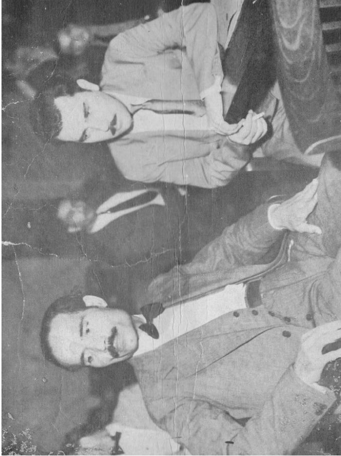
En la corte Federal, un receso durante el juicio por conspiración insurreccional en 1936. Albizu Campos y Juan Antonio Corretjer. Ambos fueron sentenciados a cumplir diez años de prisión.